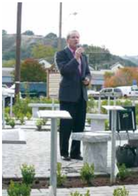
▲ケネディ前市長(ヒストリートレイルにて)