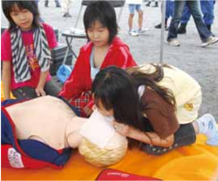
▲町営第2グラウンドで救急救命訓練をする子どもたち

四小と町営第2グラウンドをメイン会場に、倒壊建物からの救出訓練やはしご車による救助訓練など、さまざまな訓練が行われました。参加者は2,958人で、子どもから大人までたくさんの方が参加しました。