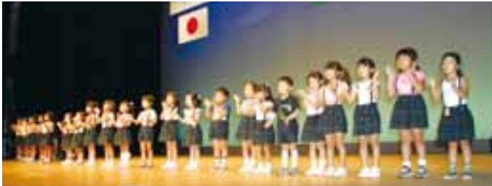
▲福正寺松濤幼稚園の園児によるオープニング（午前の部）