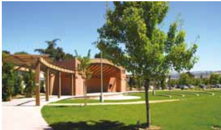
▲コミュニティ文化センターの屋外ステージ