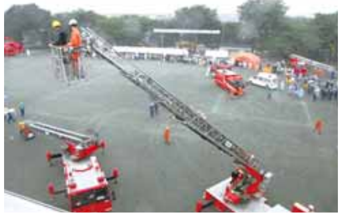
▲四小屋上からの救出訓練

四小と町営第2グラウンドをメイン会場に、倒壊建物からの救出訓練やはしご車による救助訓練など、さまざまな訓練が行われました。参加者は2,958人で、子どもから大人までたくさんの方が参加しました。