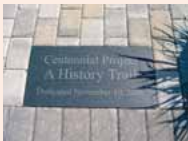
▲ヒストリートレイルの100周年記念プレート