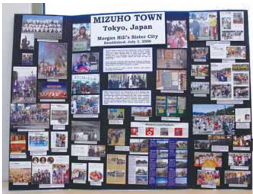
▲瑞穂町を紹介しているコーナー（コミュニティ文化センター内）